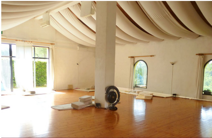
Seminar-Ort: SEMINAR-RAUM mit Holzboden (155 m 2 )