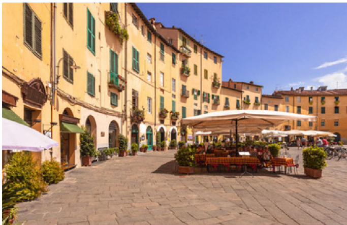
Ausflugsziel: LUCCA – ca. 53 km / 55 min.