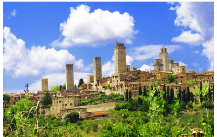
Ausflugsziel: SAN GIMIGNANO – ca. 38 km / 50 min.