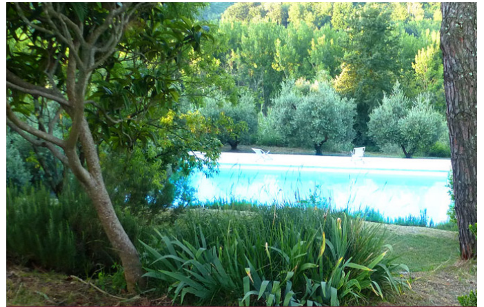
Seminar-Ort: SWIMMING-POOL im Olivenhain