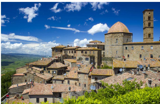
Ausflugsziel: VOLTERRA – ca. 40 km / 50 min.